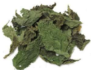
Feuilles (100%) séchées naturellement

*Traçabilité et contrôle qualité systématique des matières premières