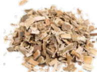
Écorces en copeaux séchées naturellement