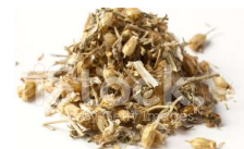
Bouquets floraux (100%) séchés naturellement